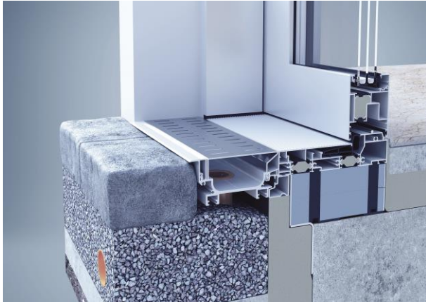
[Foto: Barrière vrijheid met het heroal drainagesysteem – hefschuifstelsel heroal S 77 SL]