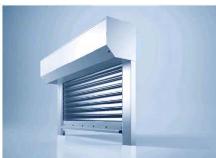
[heroal RS 37 RC 3]

Pour une meilleure qualité de vie : En plus de la protection anti-effraction certifiée, les volets roulants de sécurité heroal offrent une protection contre les intempéries ainsi que davantage de vie privée et d'efficacité énergétique.