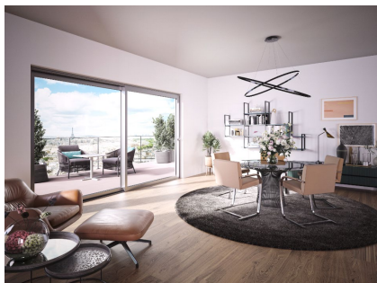
[heroal S 65 Wohnbau]

heroal S 65 è un sistema di porte scorrevoli in alluminio per ampie aperture, concepito per l'edilizia residenziale e commerciale di qualità, che si contraddistingue per la sua realizzazione ottimizzata.