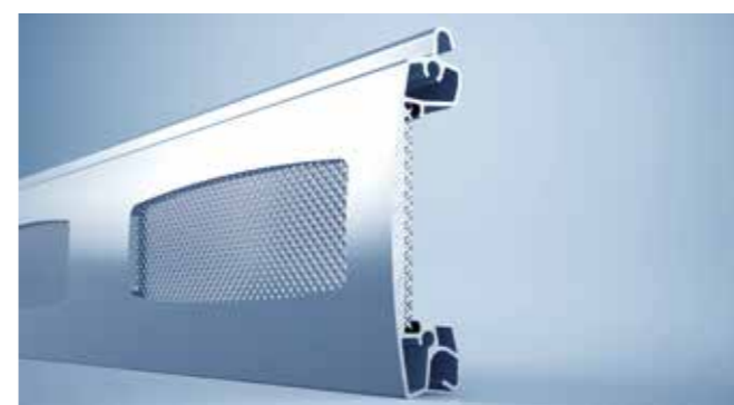
Tralieprofiel met strekmetaal als ventilatieprofiel

Voor meer ventilatie of een hogere lichtinval kan het roldeurpantser worden aangevuld met zicht-, tralie- en ventilatieprofielen – voor de vormgeving kunnen ook kleuraccenten worden toegevoegd.