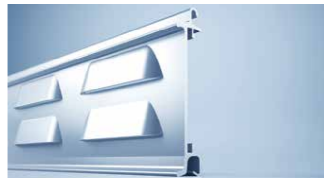
Ventilatieprofiel voor links- en rechtsdraaiende systemen