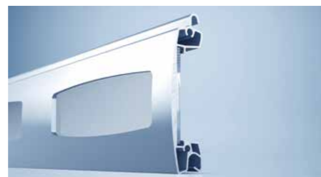
Zichtprofiel met Makrolon, ook verkrijgbaar als open tralieprofiel