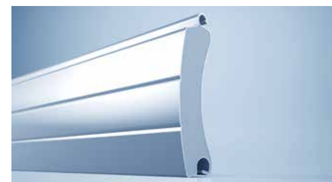
heroal RD 75 – rolgewalste roldeurlamel met groeven