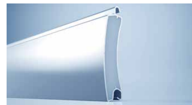
heroal RD 75 E – geëxtrudeerde roldeurlamel